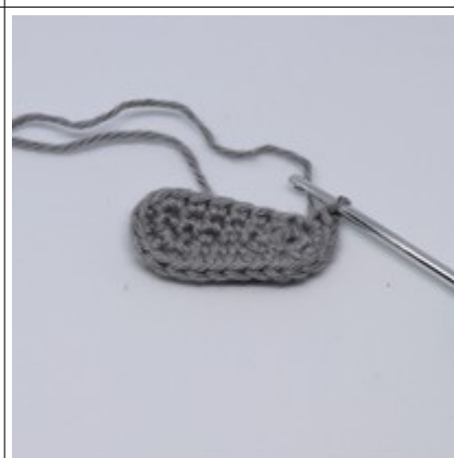
3.omg: hele omgangen