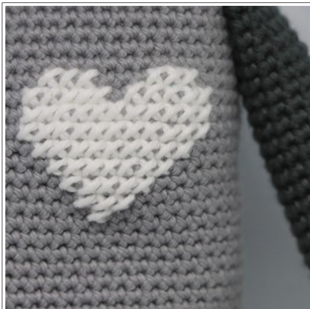
Broder et hvidt hjerte.

Inden indtagningerne på de næste 3 omgange, broderes der et hvidt hjerte på venstre side af brystet og med mørkegråt garn broderes der rundt om hjertet, som var det en påsyet lap, se billederne: